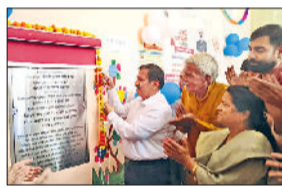
भिवानी। आंगनबाड़ी केंद्र का उद्घाटन करते उपायुक्त डॉ. मुनीश नागपाल।

उपायुक्त डॉ. मुनीश नागपाल ने गांव कलियाणा में आंगनबाड़ी प्ले स्कूल का उद्घाटन किया। कार्यक्रम में उत्कृष्ट कार्य करने वाली आंगनबाड़ी कार्यकर्ताओं को सम्मानित किया। गांव की महिलाओं व गणमान्य नागरिकों ने अपनी सहभागिता की। उपायुक्त डॉ. मुनीश नागपाल ने कहा कि हरियाणा सरकार द्वारा महिलाओं के उत्थान के लिए अनेक जनकल्याणकारी योजनाएं चलाई जा रही है। मुख्यमंत्री सैनी ने दीनदयाल लाडो लक्ष्मी योजना शुरू की है, जिससे जिले की महिलाएं लाभान्वित होंगी।