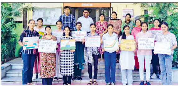
भिवानी। शिक्षकों के साथ विजेता छात्राएं।