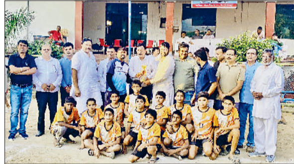
चरखी दादरी। अतिथियों के साथ विजेता टीम।

हाल ही में जीद में राज्य स्तरीय खेल प्रतियोगिताओं का आयोजन हुआ, जिसमें पूरे प्रदेश के अलग अलग जिलों से आए खिलाड़ियों ने क्षेत्र का प्रतिनिधित्व कर चुनौती रखी। इस बड़ी प्रतियोगिता में दादरी जिले के होनहार खिलाड़ियों ने शानदार प्रदर्शन किया। नगर के चंपापुरी क्षेत्र स्थित आर्य हिन्दी संस्कृत महाविद्यालय गुरुकुल में अध्ययनरत विद्यार्थियों ने अपने खेल के जरिए राज्य स्तरीय स्कूली खेल खो-खो प्रतियोगिता में जिला दादरी का प्रतिनिधित्व कर अंडर-14 में द्वितीय तथा अंडर-17 में पूरे हरियाणा में तृतीय स्थान प्राप्त किया और जिले व गुरुकुल का नाम रोशन किया है। विजेताओं के गुरुकुल परिसर में पहुंचने पर कार्यकारिणी व गुरुजनों ने उनका भव्य स्वागत कर