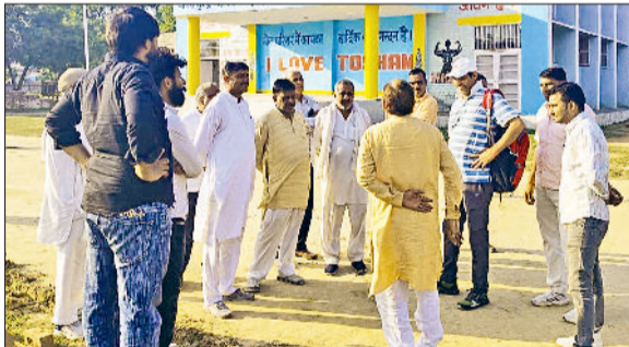
तोशाम। खेल मैदान का निरीक्षण करते हुए।