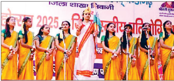
भिवानी। आयोजित कार्यक्रम में अपनी प्रस्तुती देती प्रतिभागी।