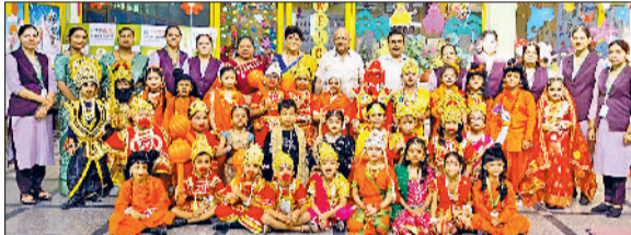
भिवानी। अतिथियों के साथ रामायण रोल प्ले अदा करने वाले विद्यार्थी।