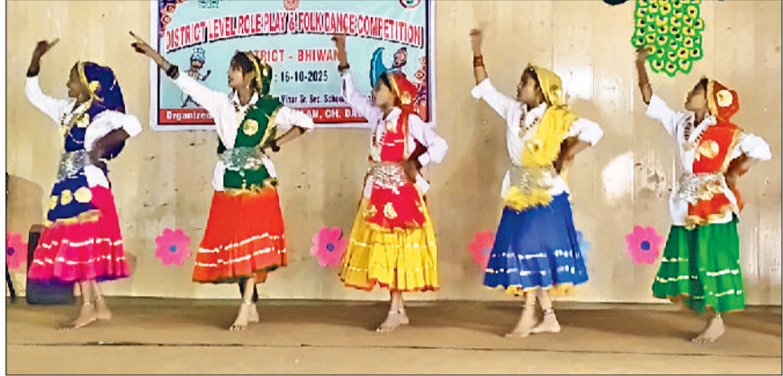
बवानीखेड़ा। जिला स्तरीय रोल प्ले और फोक डांस प्रतियोगिता का आयोजन में उपस्थित।